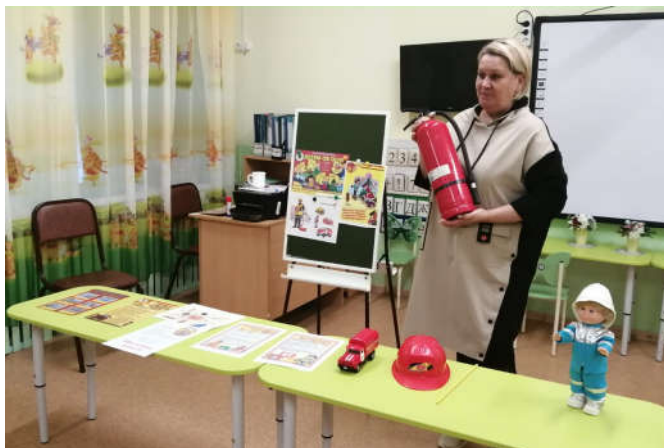
Воспитатели Старшей группы "Сказка"